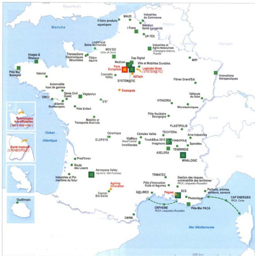
Carte 1 : Les 71 pôles de compétitivité

NB. La localisation cartographique des pôles n'a qu'une fonction représentative et n'a pas vocation à être le reflet exhaustif de la réalité.