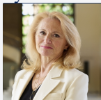
Environnement et Nature