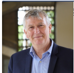
ement et Nature