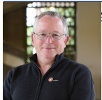
es Élus CCI