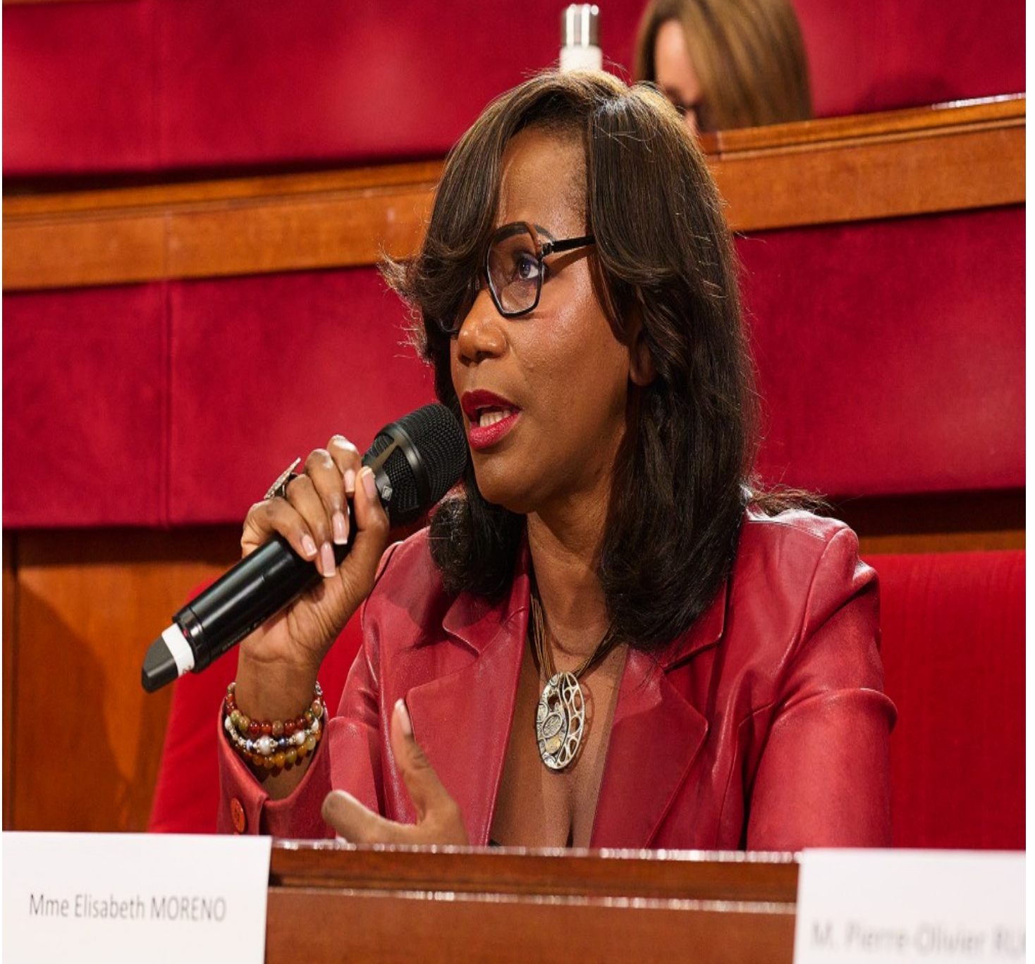
Mme Elisabeth MORENO