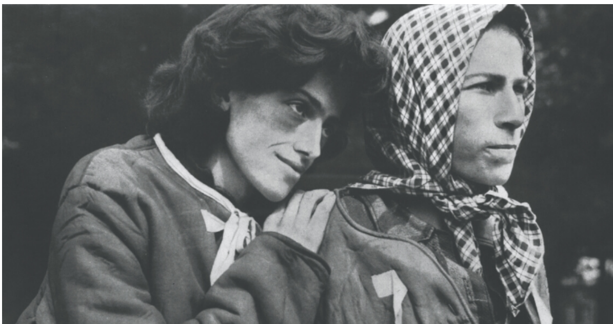
Deux rescapées du camp de Bergen-Belsen, avril 1945.

Elle s'inscrit dans le cadre du partenariat signé entre le CESE et la Fondation pour la Mémoire de la Déportation (FMD) " Mémoire et Vigilance ", qui à l'occasion du 75 e anniversaire de la fin des camps de déportation, ont organisé plusieurs initiatives dont cette journée.