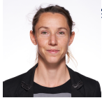
Marie-Amélie LE FUR